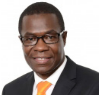
Hon. James Opiyo Wandayi, Président PAC Kenya Secrétaire général - AFROPAC